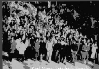
Karl Marx, Friedrich Engels Manifest del Partit Comunista Col·lecció Clàssica