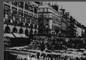
Karl Marx La guerra civil a França Col·lecció Clàssica

La Guerra Civil a França. La Comuna de París és la primera experiència coneguda de poder popular organitzat. Marx relatà aquest episodi mentre aquest estava succeint, a través dels manifestos que redactà per l'Associació Internacional de Treballadors. Aquests textos revelen el mètode d'interpretació de la realitat que Marx teoritzà sota els principis del materialisme històric, en paraules d'Engels, "la capacitat de l'autor per penetrar amb tota clarividència el caràcter, l'abast i les conseqüències inevitables dels grans esdeveniments històrics quant aquests es desenvolupen davant els nostres ulls, o tot just acaben de produir-se".