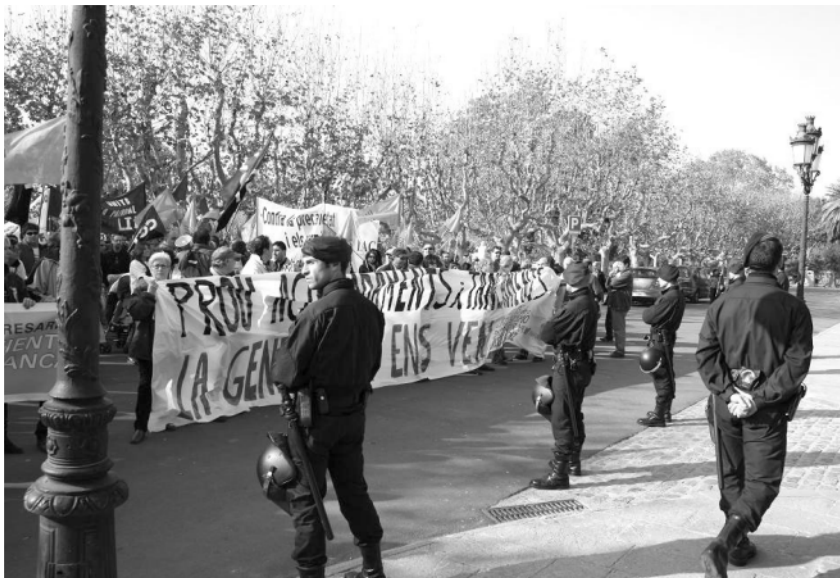
Manifestació contra els tancaments d'empreses. Barcelona, 2007

El model productiu dissenyat i executat per la burgesia amb el suport institucional dels diferents governs estatals i autonòmics, ha tingut com a aliats els dos sindicats majoritaris als Països Catalans: CCOO i UGT. El paper d'aquests dos grans sindicats ha estat el de desactivar les reivindicacions de les treballadores, presentar els tancaments i els acomiadaments com un mal inevitable i esdevenir davant l'aparador mediàtic com els obrers comprensius i negociadors davant la "radicalitat maximalista"